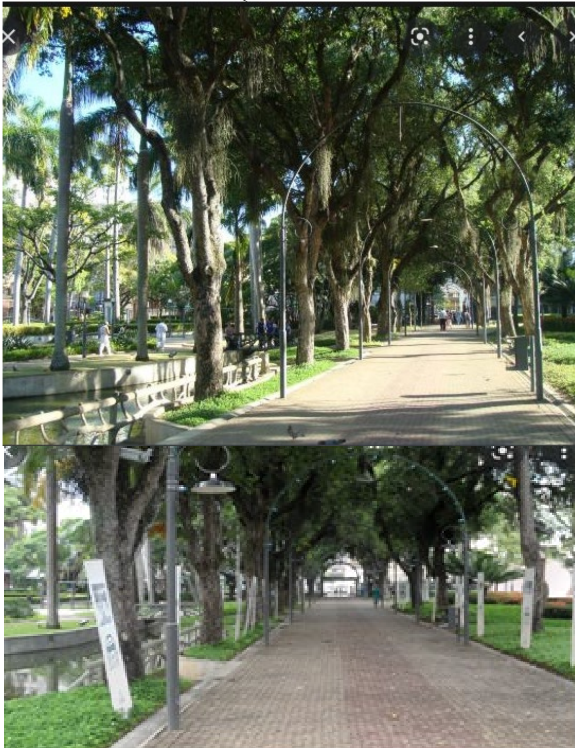
IMAGEM PANORÂMICA DO PARQUE MOSCOSO E ENTORNO