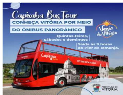
Ponto de partida: Próximo ao Píer de Iemanjá na Praia de Camburi.