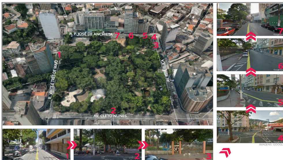
IMAGEM PANORÂMICA DO PARQUE MOSCOSO E ENTORNO

LOCALIZAÇÃO DA VILA DO PAPAÍ NOEL (IMAGENS MERAMENTE SUGESTIVAS ). LOCAL: PARQUE MOSCOSO