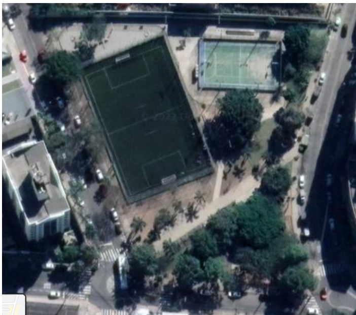
IMAGEM DE SATELITE DA PRAÇA E ENTORNO